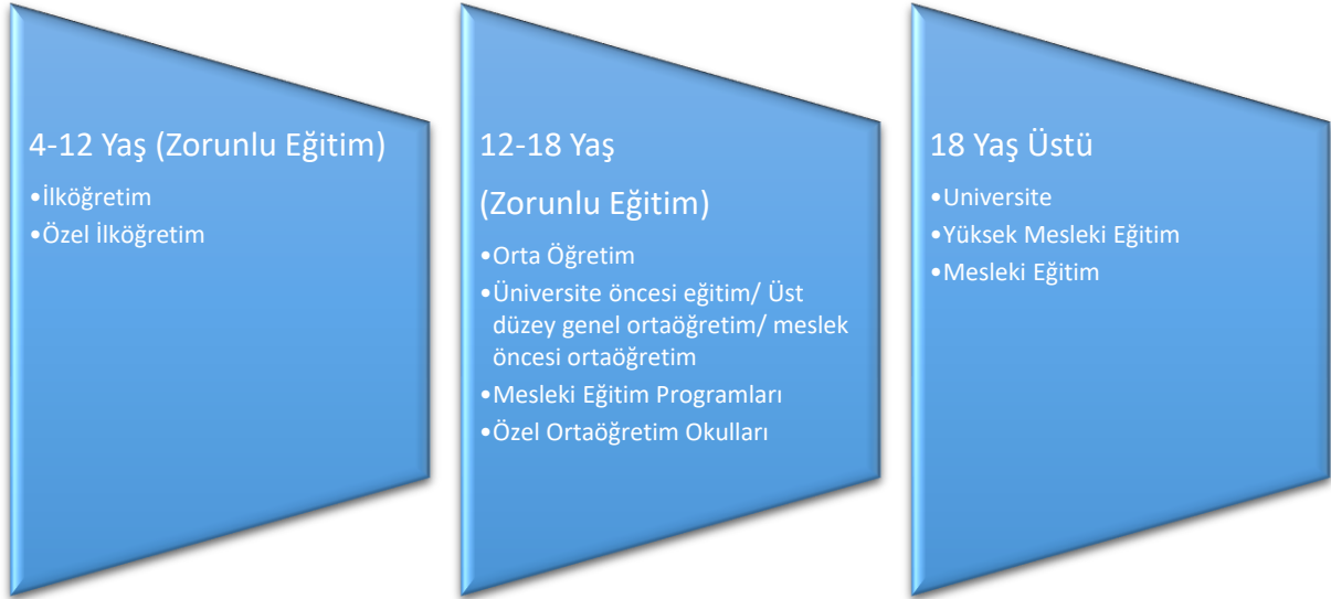
Şekil 03- Hollanda'daki Eğitim Sistemine Genel Bakış

Kaynak: (Béguin, Anton & Kremers, Ed & Alberts, René, 2022) 13